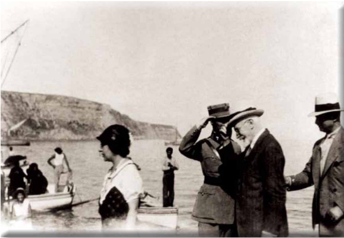
Ο Ελ. Βενιζέλος το 1928 στην Καλαμαριά Θεσσαλονίκης.

Πολύ παραστατικά περιγράφει τη συμπεριφορά των γηγενών απέναντι στους πρόσφυγες ο μεγάλος λογοτέχνης της Θεσσαλονίκης, Γιώργος Ιωάννου: «Οι εδώ πληθυσμοί, οι ντόπιοι, οι εντός των ορίων του ελεύθερου κράτους γεννημένοι και εγκαταστημένοι δε δέχτηκαν καθόλου μ' ευχαρίστηση τους πρόσφυγες. Τους είδαν σαν ορδές, που ήρθαν να τους πάρουν γη, σπίτια και δουλειές. Αυτά τα αισθήματα αναπτύχθηκαν κυρίως στη Βόρειο Ελλάδα, Θεσσαλονίκη ειδικότερα, όπου κατέφυγε το μεγαλύτερο μέρος της προσφυγιάς και όπου η πρόσφατη αποχώρηση των τουρκικών πληθυσμών είχε αφήσει αμύθητες ακίνητες περιουσίες. Τις περιουσίες αυτές, τις ροκάνιζαν ήδη και ετοιμάζονταν να τις αποχωνέψουν οι εντόπιοι, οι δυτικομακεδόνες, οι διάφοροι δήθεν μακεδονομάχοι και οι παλαιοελλαδίτες αξιωματικοί, χωροφύλακες, δημόσιοι υπάλληλοι – με ένα λόγο οι ελευθερωτές. Όλοι αυτοί λύσσαξαν με τους πρόσφυγες, τους φτωχούς και ελεεινούς κυρίως τους απομάκρυναν, τους έκλεισαν κατάμουτρα τις πόρτες, τους γκετοποίησαν, τους απομάκρυναν κοινωνικά και προπαντός προσπάθησαν να τους συντρίψουν ψυχικά». 210