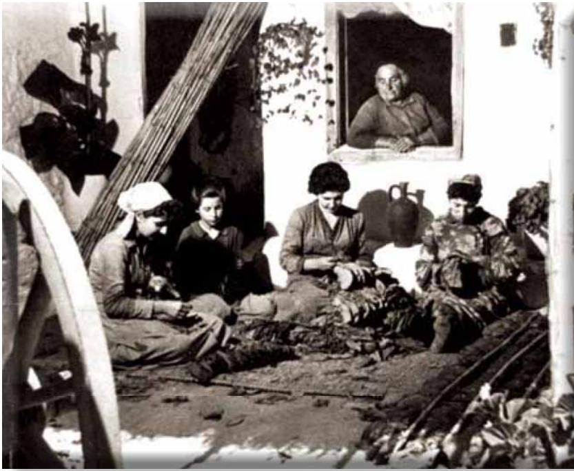
Το βελόνιασμα του καπνού.

ρασαν τρόφιμα, ρούχα, κλινοσκεπάσματα, τέντες, φάρμακα σ' όλους τους άστεγους πρόσφυγες.